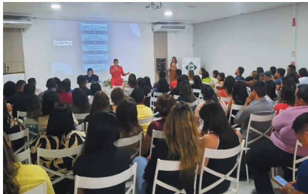
Evento acontece na primeira semana de setembro

Não existem regras específicas para licitação nesse período, mas existem despesas que não podem acontecer, logo essa licitação