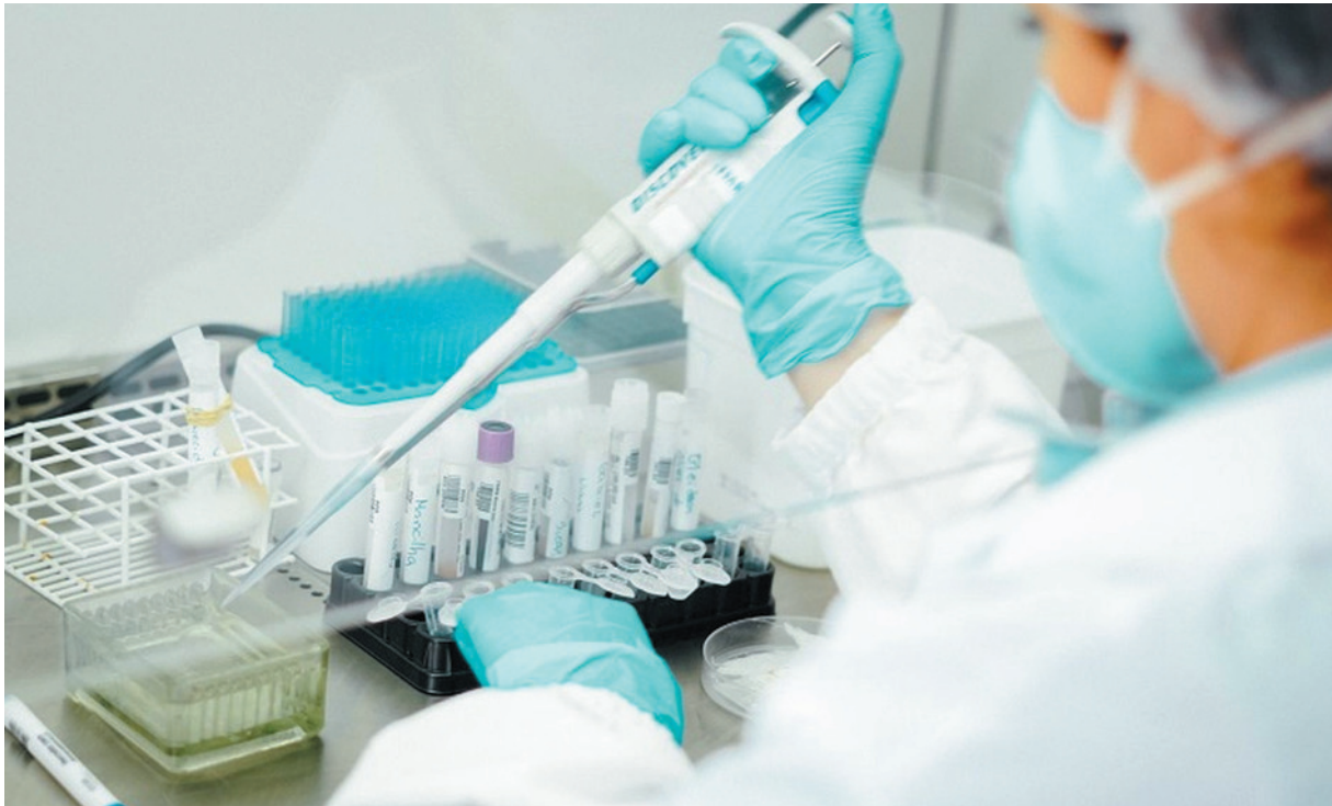
Cievs reforça alerta ao Norte de Minas para a confirmação de casos da doença