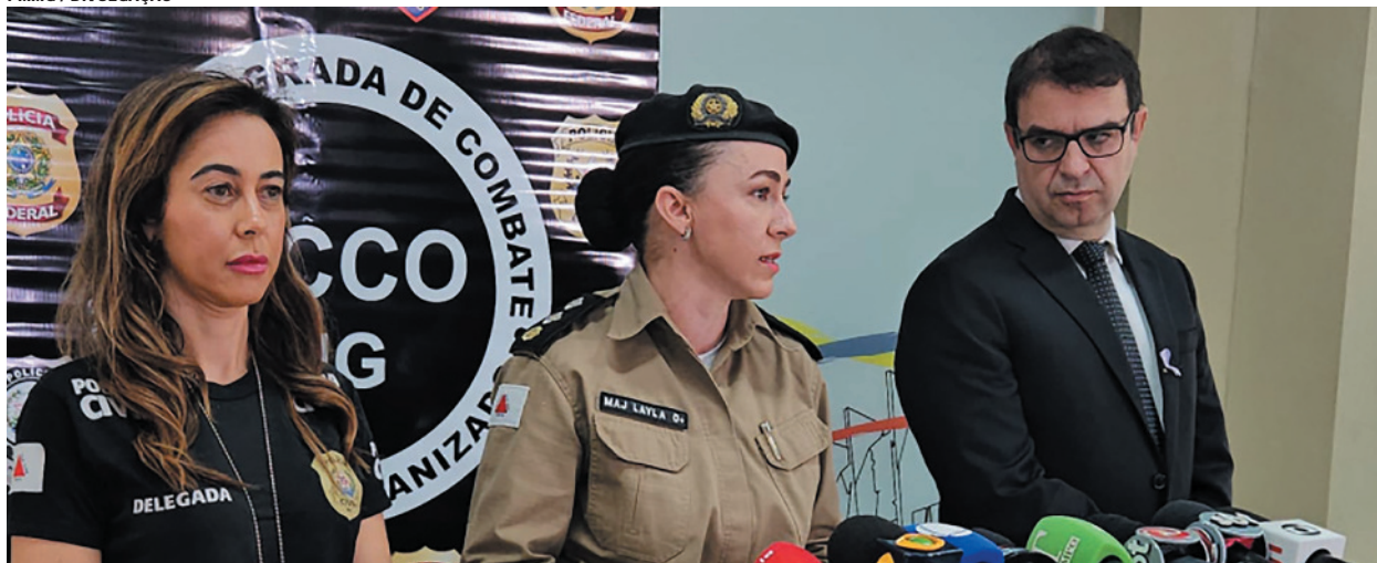
Balanço das ações do Agosto Lilás, mês de combate a esse tipo de crime, foi apresentado por representantes das Forças de Segurança nesta quinta-feira

os presos possuem registros também por homicídios, estupros, lesão corporal, ameaça descumprimento de medida protetiva, tráfico ilícito de drogas, roubo, furto, receptação, estelionato e porte ilegal de armas. As prisões somam