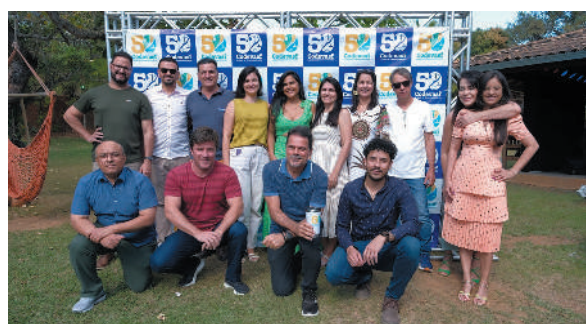
Equipe de funcionários da área de irrigação da empresa