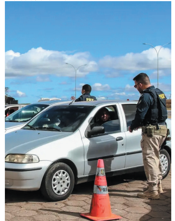
Ações garantem a segurança e fluidez do tráfego