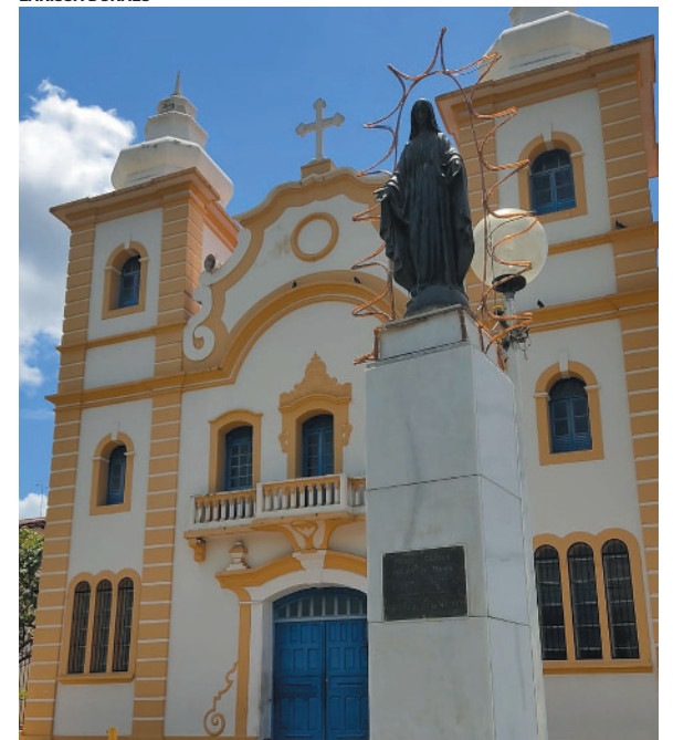
Programação religiosa será extensa na cidade