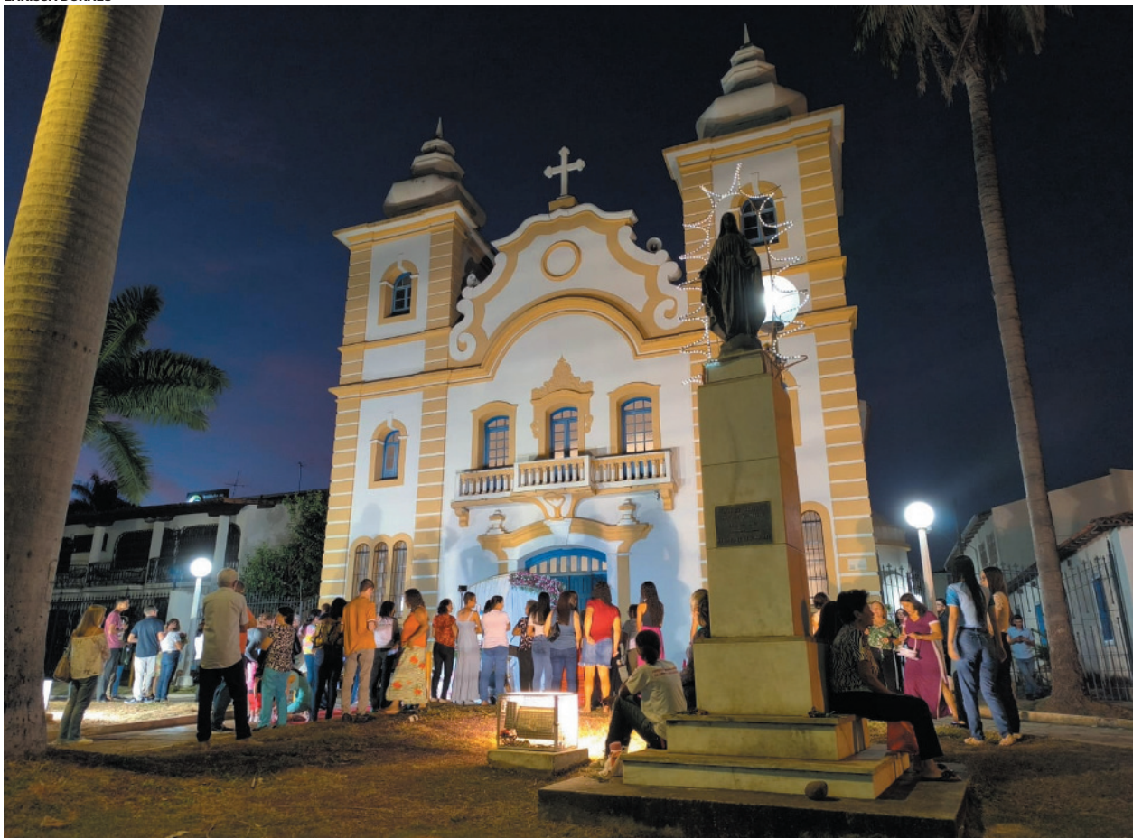
Devido à data, Montes Claros terá uma vasta programação católica para os fieis