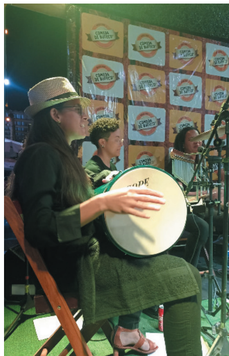
O evento reuniu 22 bares participantes, convidados e imprensa