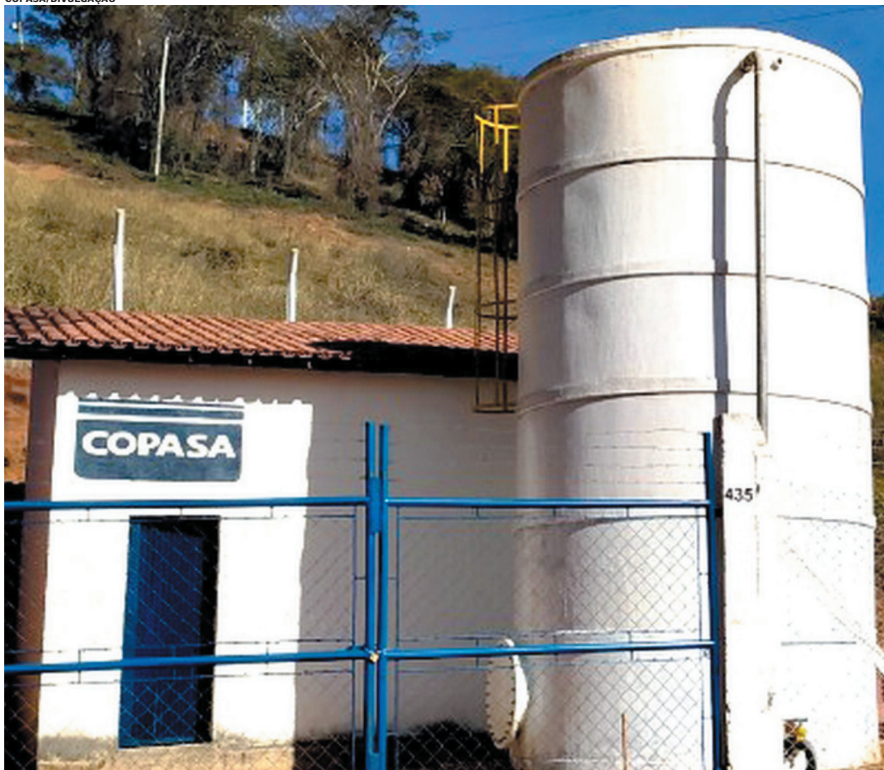
Atualização deve ser realizada com apresentação de documentos em uma agência da Copasa ou via site