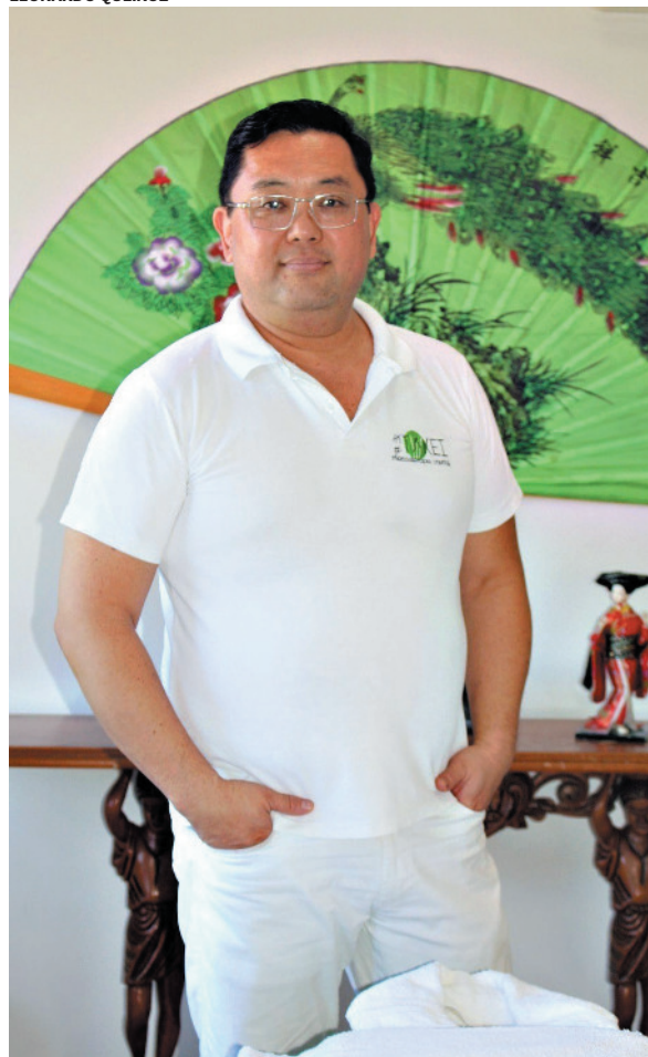
Técnicas promovem o equilíbrio e tranquilidade