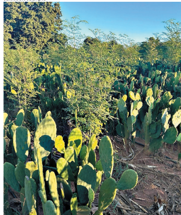
Planta 'promete' benefícios aos produtores