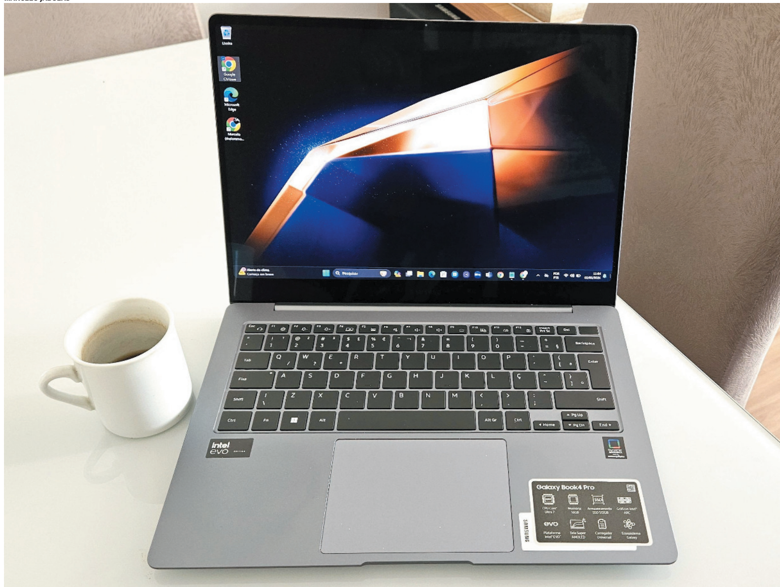
Galaxy Book4 é sofisticado, leve e fácil de carregar

desempenho da máquina. Num primeiro momento a IA vai oferecer melhor performance, economia de energia de forma inteligente e não apenas por um padrão de configuração.