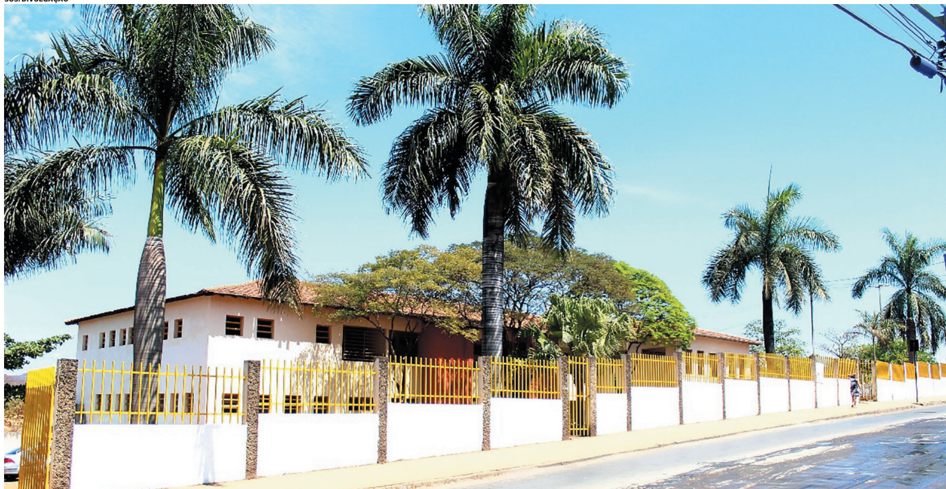
Montes Claros receberá mais de R$ 2,4 milhões para construção de um Centro de Atenção Psicossocial