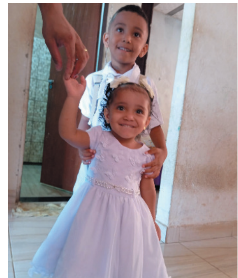
Os irmãos felizes ao receber o batismo