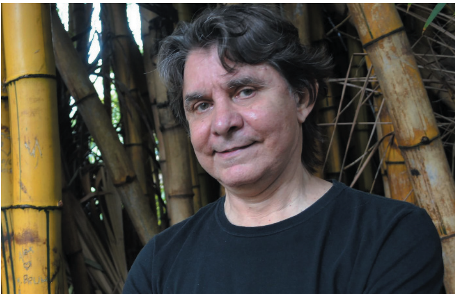
o cantor Lô Borges se apresenta no próximo sábado (8) nas comemorações dos 8º anos da Sociedade Rural de Montes Claros

Destinado a crianças de 2 a 12 anos, o parque funcionará até o dia 25 de junho, de segunda a sábado, das 10h às 22h; domingos, das 14h às 20h. O regulamento de participação pode ser consultado na bilheteria do local e no site do Montes Claros Shopping.