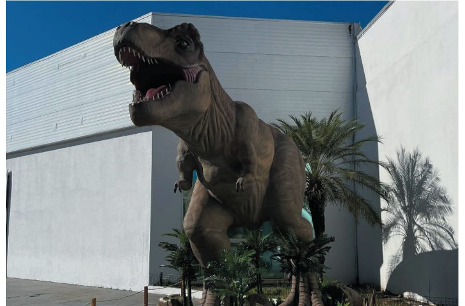
Dinos Escape Experience funcionará até 25 de Junho no Montes Claros Shopping