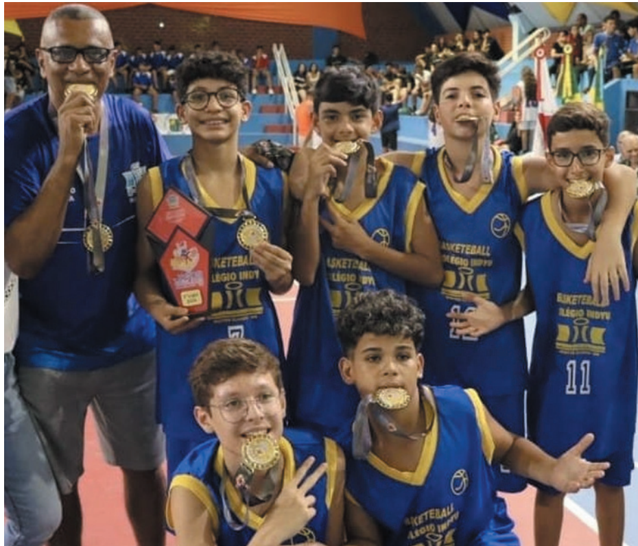
Feminino e masculino do Basquete Indyu disputam microrregional do JEMG