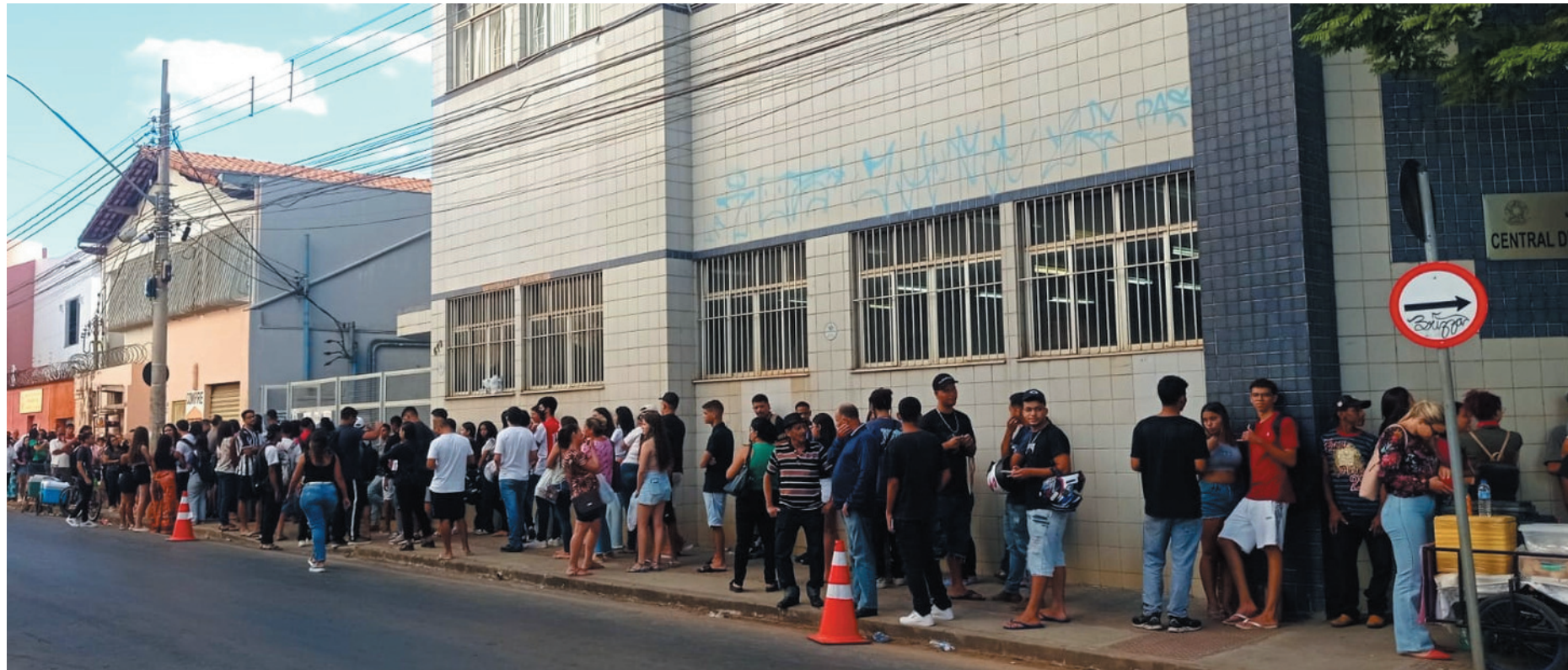
Eleitores montes-clarenses lotaram a Central de Atendimento em busca de regularizar situação para terem direito ao voto nas eleições de outubro