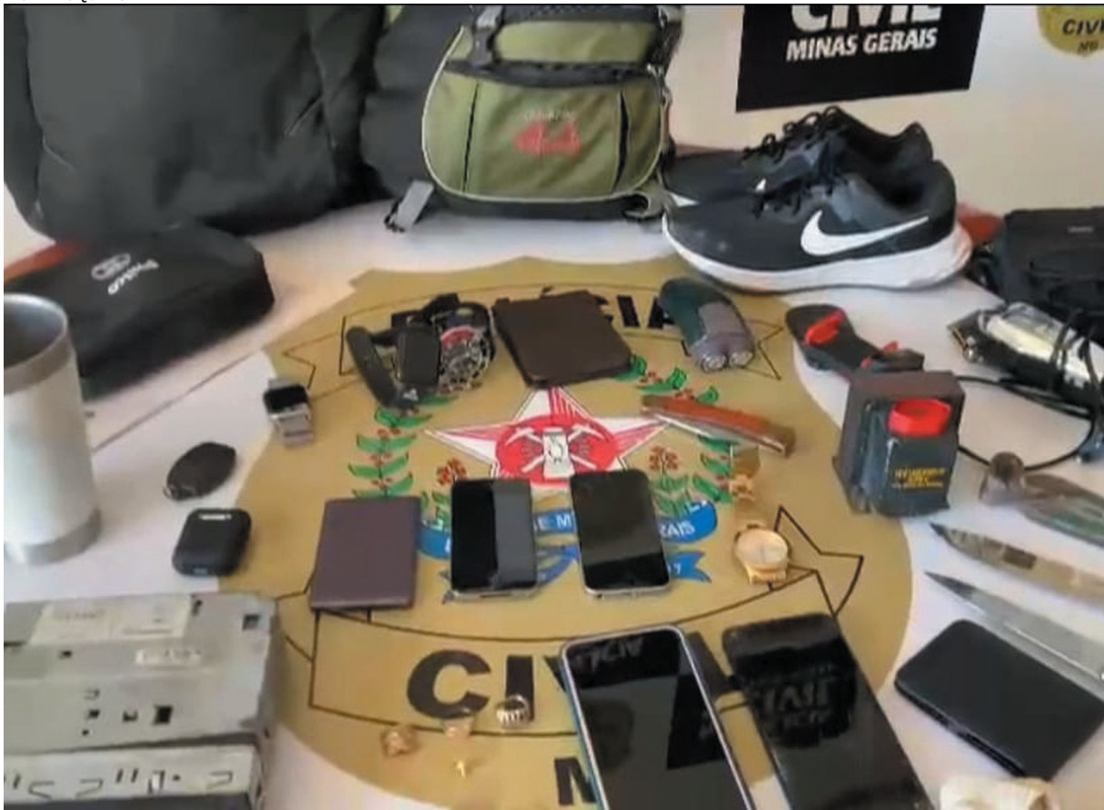
Material encontrado com os suspeitos dos roubos patrimoniais e apresentado pelas forças policiais