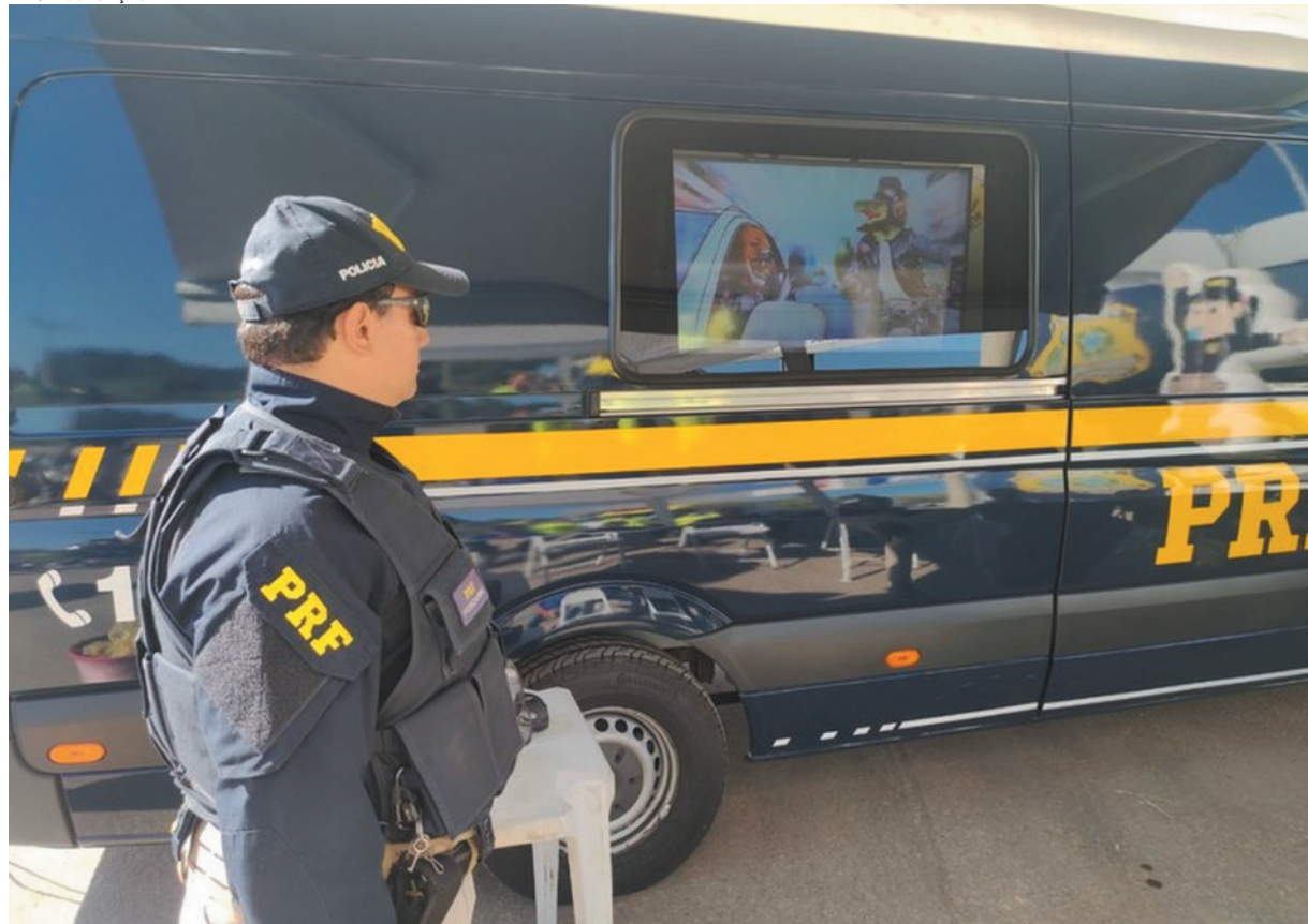
A campanha quer que todos trabalhem juntos para tornar o trânsito mais seguro