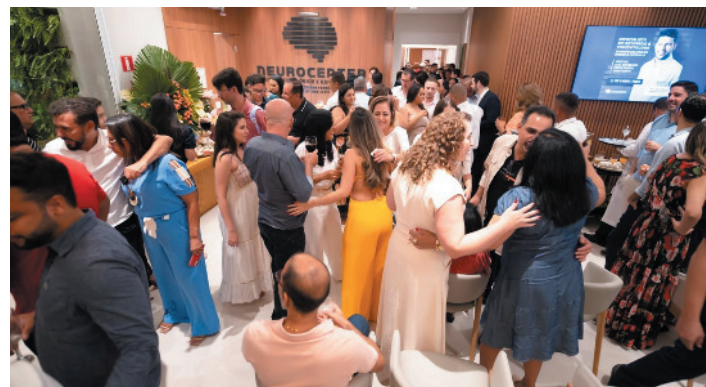
O evento foi bastante prestigiado pela sociedade de Salinas