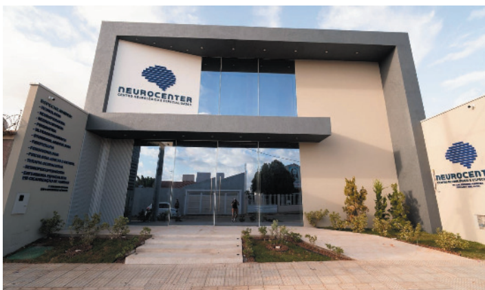
A Neurocenter está localizada na Avenida Maroto Ferreira, 377, em Salinas