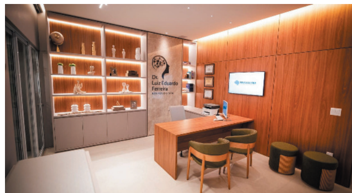
Detalhes do espaço