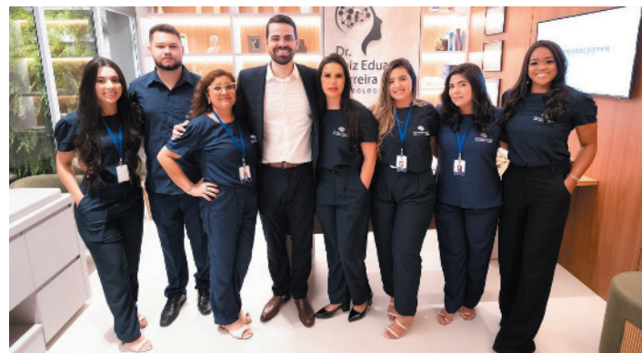
A eficiente equipe da Neurocenter