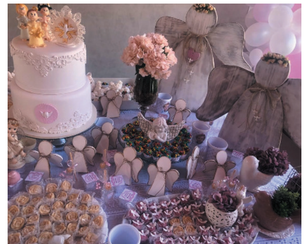
Detalhes da linda mesa de bolo e doces