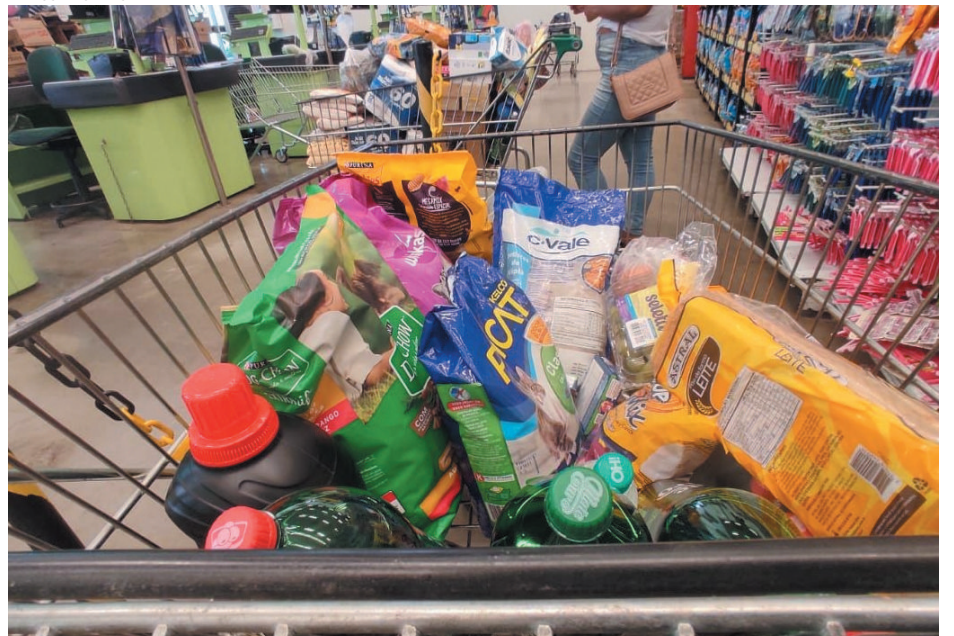
15 itens compõem a esta Básica Nacional de Alimentos