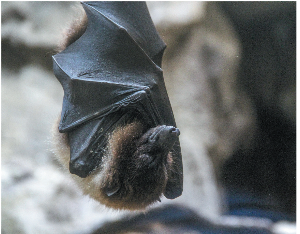
raiva em seres humanos é letal, com sintomas como dor de cabeça, febre e náusea