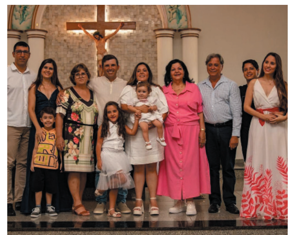
Familiares reunidos: pais, avós e tios