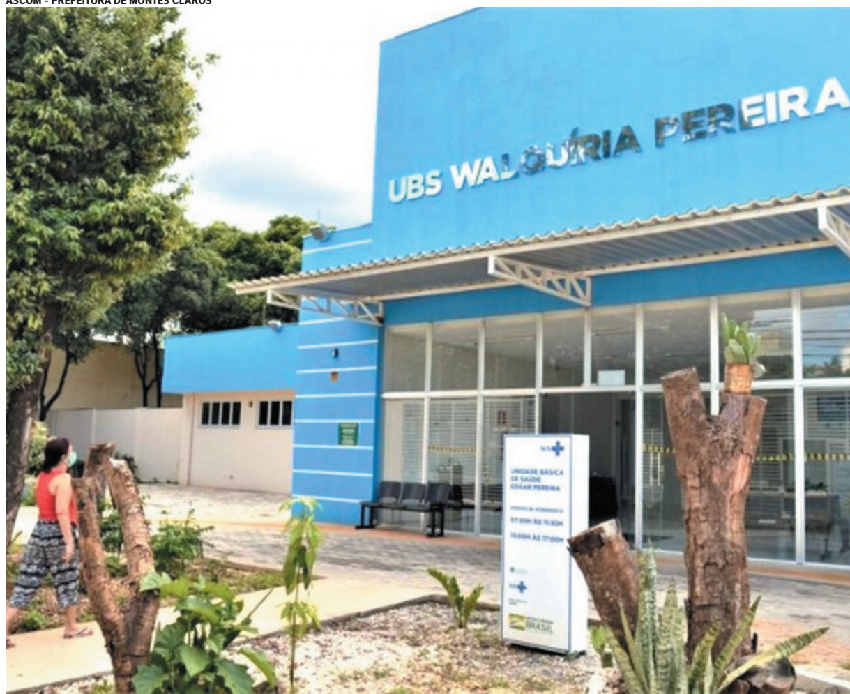
A Portaria 3.617, garante um investimento de R$ 2,4 milhões para a cidade de Montes Claros