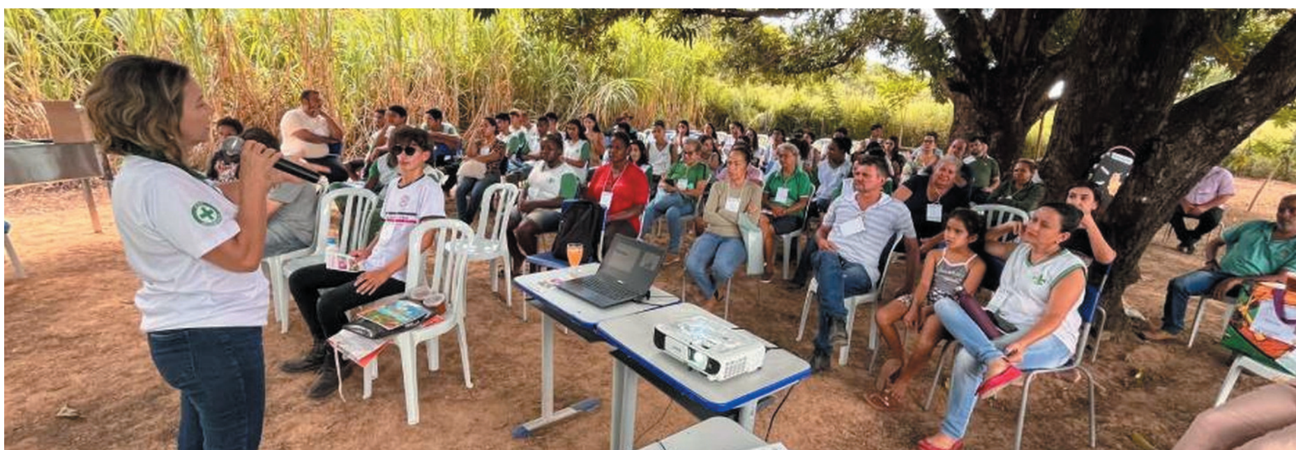
Parceria entre Fucam, Seapa, Emater e Epamig promove curso de fruticultura e apicultura a fim de desenvolver perspectivas de geração de trabalho e renda

► Governo oferece capacitação agrícola no Norte de Minas