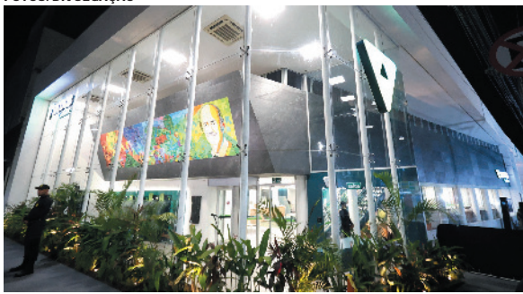
Fachada da agência matriz, Centro Cooperativo Heli Penido