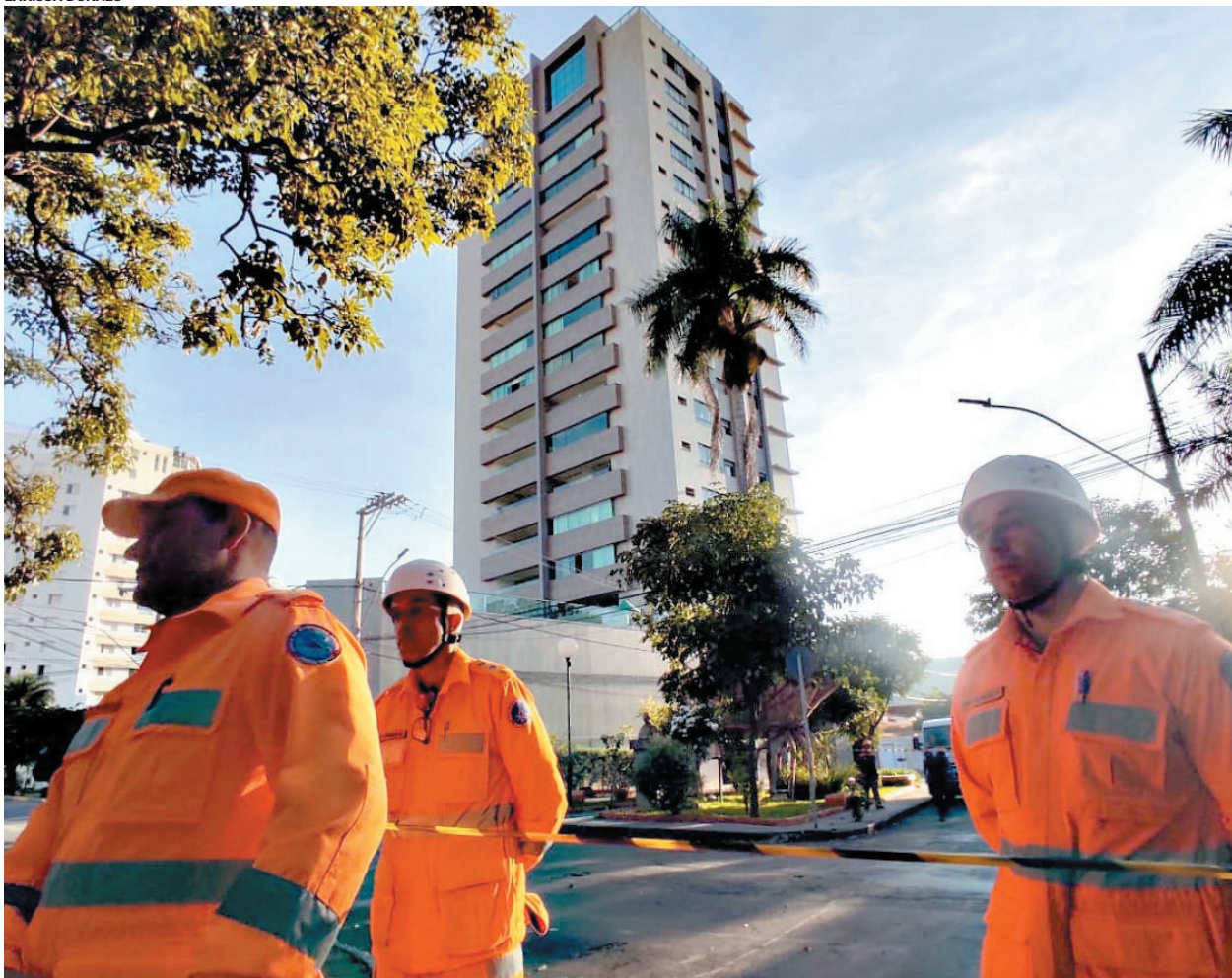
Após a detecção da trinca, tanto o prédio quanto a vizinhança próxima foram evacuados