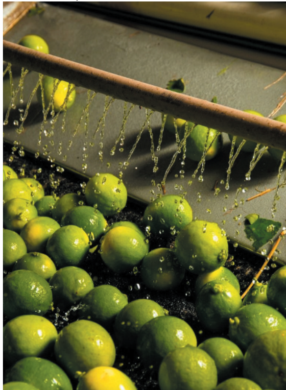
Região é conhecida por qualidade de produção