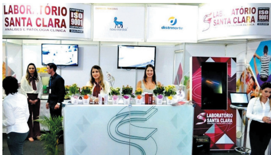
Excelente atendimento da equipe LS!

O laboratório possui 17 unidades em Montes Claros e mais 13 unidades nas cidades vizinhas