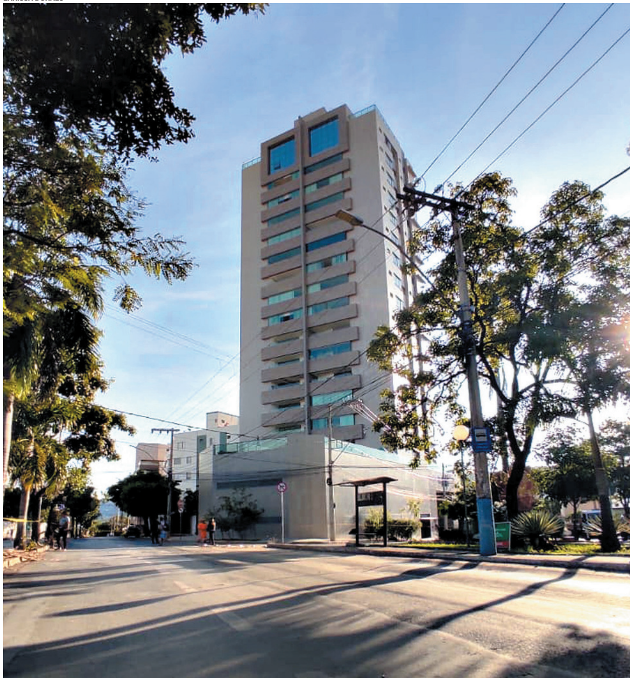
Moradores do edifício notam a trinca após um estrondo. Segundo relatos, o incidente ocorreu por volta das 13h

que não representem risco para nenhum morador. Foi evacuado o prédio e duas casas que estão abaixo”, comentou.